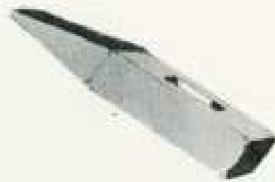
IV 26 B