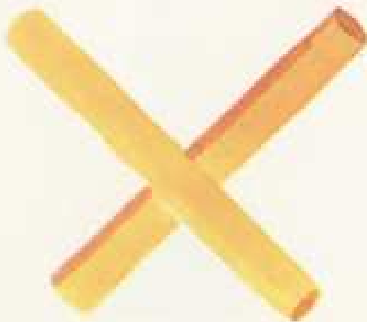
IV 26 D