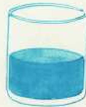
IV 25 F