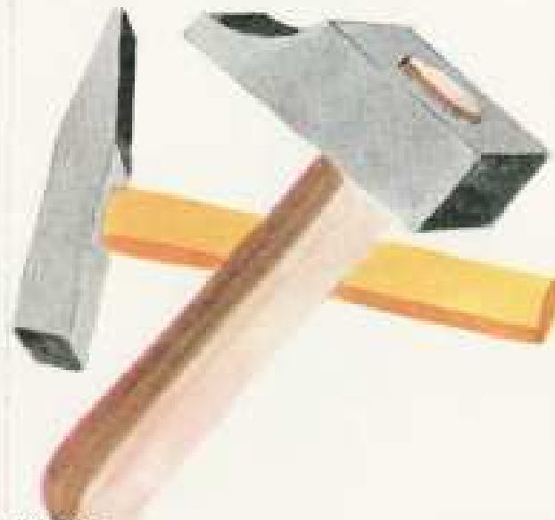
IV 26 E