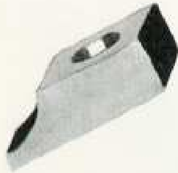
IV 26 A