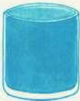
IV 25 D