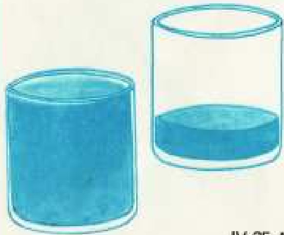
IV 25 A