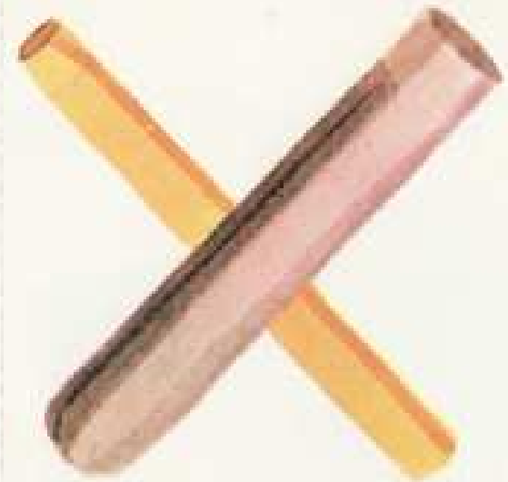
IV 26 C