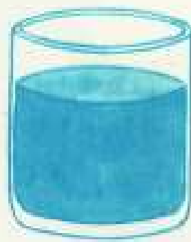
IV 25 E