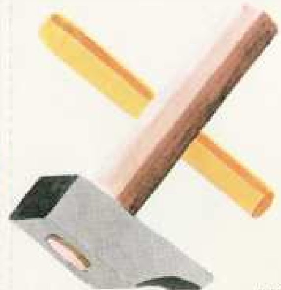
IV 26 F