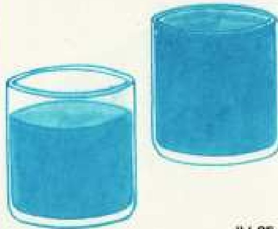
IV 25 B