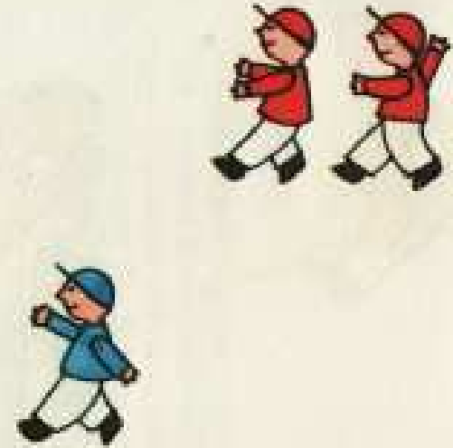
IV 16 C