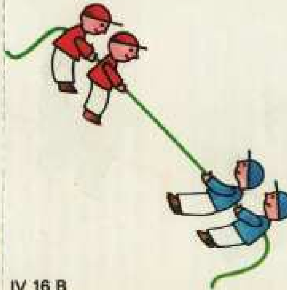
IV 16 B