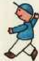
IV 16 E