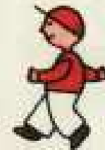
IV 16 F