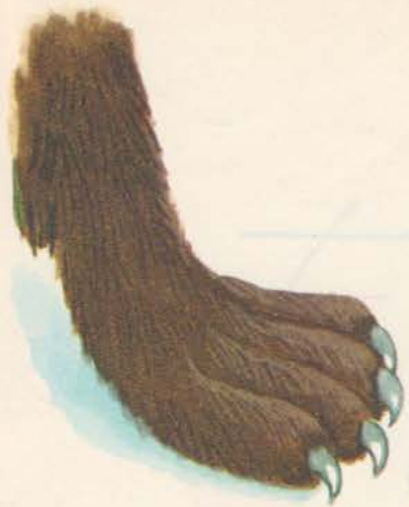
Zampa di lupo

Mamma capra doveva andare al mercato. Prima di uscire disse al figliolo: — Non aprire a nessuno. E attento al lupo!