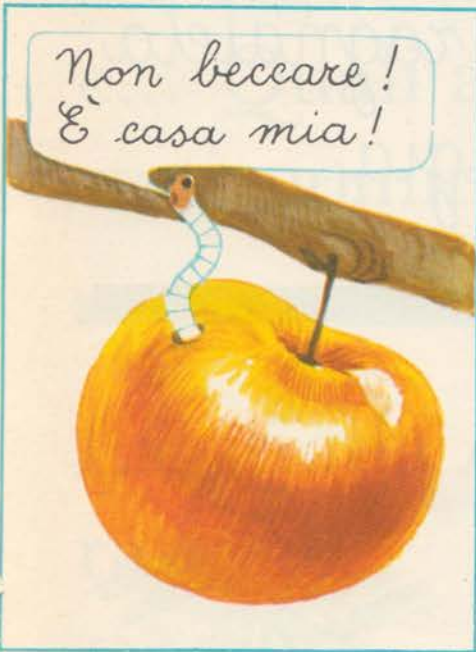
Un vermetto sbuca fuori e grida.

Un uccellino vuole mangiare una mela, ma un vermetto non lo fa mangiare.