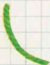
III 13 D