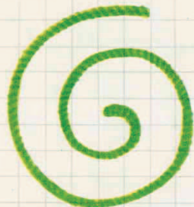
III 13 A

Quale è il filo più lungo? quale è il filo più corto? Metti in ordine le figurine a cominciare dal filo più lungo. Prova a mettere dei veri fili sopra ogni disegno delle fig., poi stendili e confronta la lunghezza dei fili. Mettili in ordine dal più lungo al più corto.