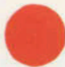
III 12 B