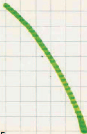
III 13 E