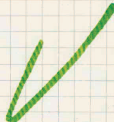
III 13 C