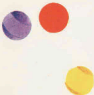
III 12 D