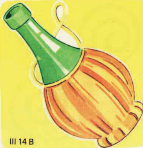
III 14 B