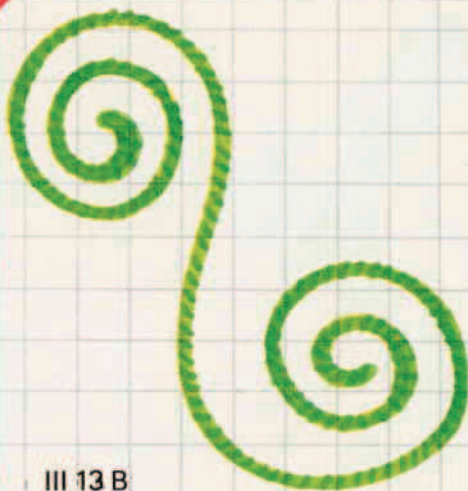
III 13 B