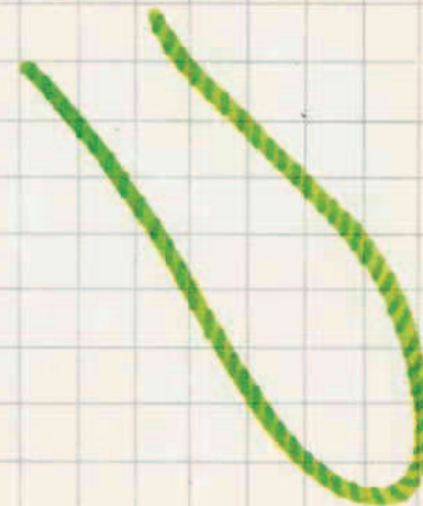
III 13 F