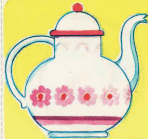
III 14 C