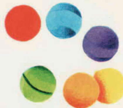
III 12 C