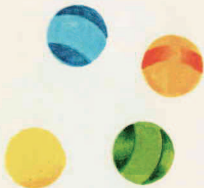
III 12 A

Indica la fig. in cui ci sono meno palline, la fig. in cui ce ne sono di più. Metti in fila tutte le figurine, aggiungendole una alla volta, in modo da mettere in ordine da meno palline a più palline.