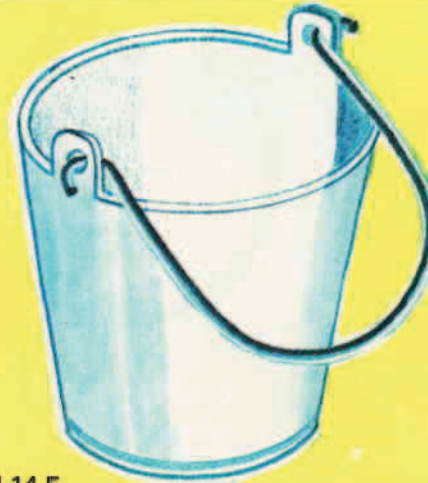
III 14 F