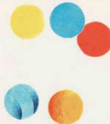
III 12 F