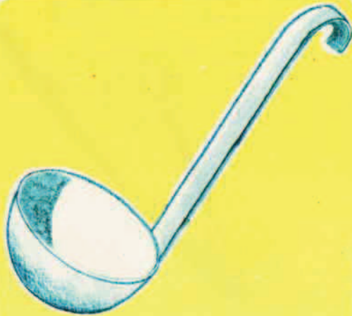
III 14 A

Contiene più acqua un secchio pieno o un fiasco pieno? una tazza piena o un bicchiere pieno? Metti in ordine a partire dal recipiente che può contenere più acqua. Prova con la sabbia o con l'acqua: quante tazzine ci vogliono per riempire la teiera? Con un fiasco pieno, quanti bicchieri si riempiono?