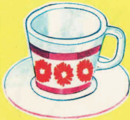
III 14 D