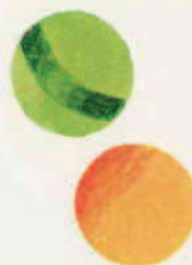
III 12 E